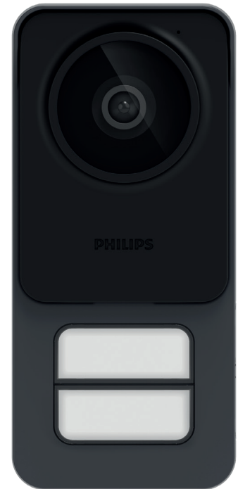
Modalità 2 pulsanti, 2 famiglie